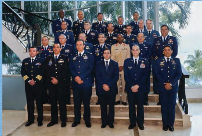
Líderes de las Fuerzas Aéreas Americanas.