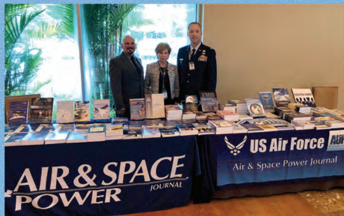
Personal de la Revista Air and Space Power Journal-en Español, con libros de la Prensa de la Universidad del Aire de EE. UU. (AU Press)